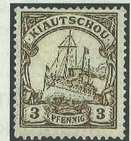
Eine Briefmarke der Kolonie Kiautschou.

Der einstige deutsche Kolonialstützpunkt Qingdao (Tsingtau) in der ostchinesischen Küstenprovinz Shandong ist heute eine florierende Großstadt mit über sieben Millionen Einwohnern. Qingdao, das 1914 an die Japaner fiel und 1922 an China zurückgegeben wurde, hat sich nach der Öffnung Chinas 1978 wirtschaftlich rasant entwickelt. Baustellen, aus denen Bürotürme und Wohnblocks wachsen, künden von einem für China typischen Bauboom – dem mitunter auch Kolonialbauten zum Opfer fielen. Doch die bedeutendsten Gebäude der Stadt blieben erhalten, alle alten Kolonialhäuser sind seit ein paar Jahren geschützt. Qingdao wird gelegentlich als kleinere Schwester von Shanghai bezeichnet, was auch insofern nicht unpassend ist, als die Metropole im Süden ein französisches Viertel hat – und Qingdao eben ein deutsches. Qingdao ist einer der wenigen bedeutenden Badeorte in China. Die Deutschen gaben der Stadt einst den Beinamen „Neapel am Gelben Meer“. Die Stadt besitzt den drittgrößten Hafen Chinas und den