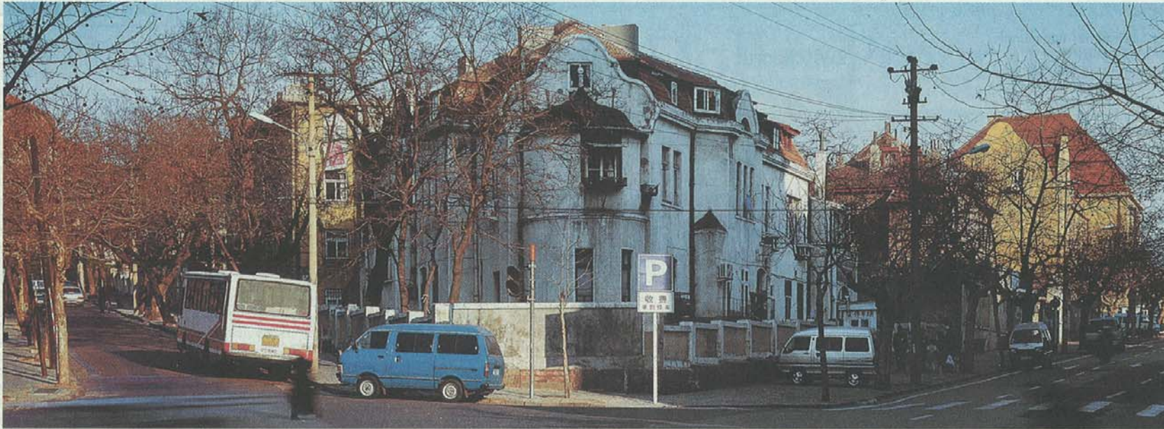
Könnte in München sein – ist aber in Qingdao: Das Bild zeigt die Zhongshan Straße im alten deutschen Wohnviertel der ostchinesischen Küstenstadt.