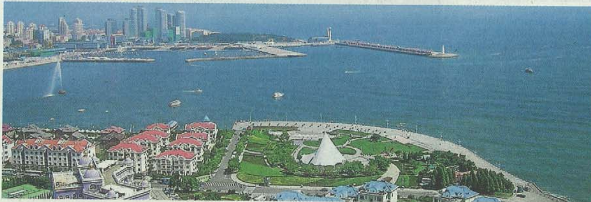
Gute Aussicht: der Blick von der bayerischen Repräsentanz in Shandong auf die Bucht von Qingdao.