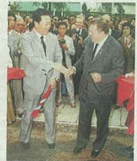
Partner: Franz Josef Strauß 1985 mit dem Provinz-Chef von Shandong (in Qingdao).

Der Freistaat Bayern hat mehrere Partnerprovinzen. Dazu zählen Oberösterreich, Sao Paulo in Brasilien, Quebec in Kanada, Georgia, Westkap in Südafrika – und die ostchinesische Küstenprovinz Shandong. Die Zusammenarbeit begann bereits in den frühen achtziger Jahren. Am 9. Juli 1987 begründeten Bayern und Shandong